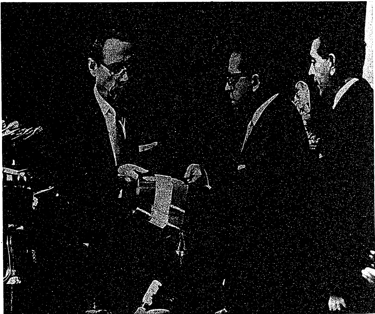
El licenciado Gustavo Díaz Ordaz recibe del Presidente del Congreso de la Unión, diputado Alfonso Martínez Domínguez, la banda presidencial. A la derecha aparece el ex-presidente licenciado Adolfo López Mateos

dividuales y al impedir abusos de poder o al repararlos, desempeña una función decisiva para la vida pacífica de la nación.