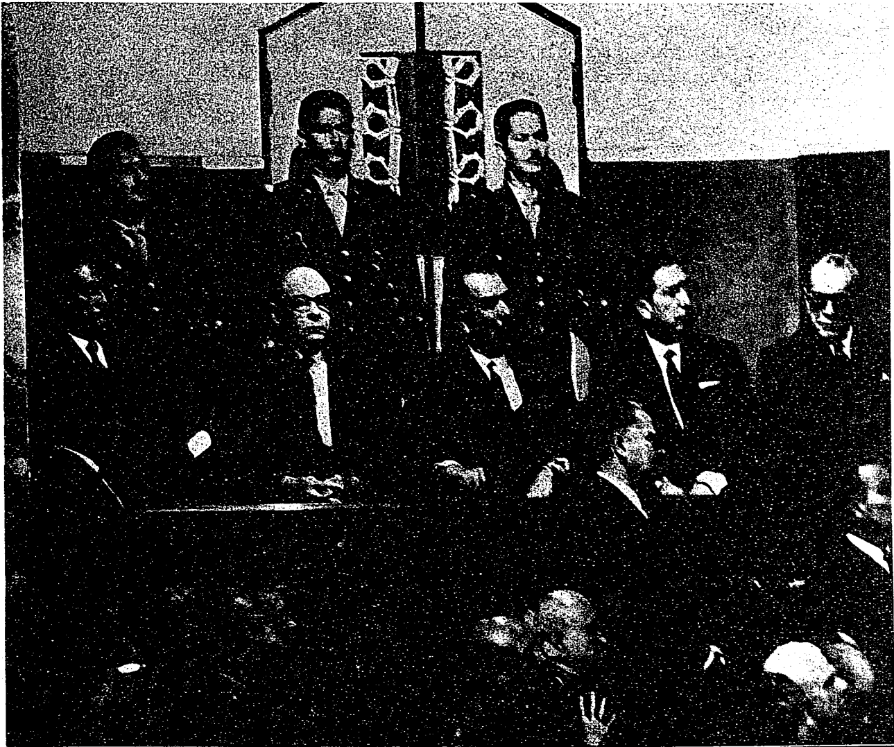
Por primera vez en la historia de México, los ex-presidentes de la República, como un símbolo de unidad en torno del Presidente que iniciaba su mandato, licenciado Gustavo Díaz Ordaz, asistieron al solemne acto en que rindió su protesta ante el Congreso de la Unión. Aparecen (de Izq. a Der.) licenciado Emilio Portes Gil, general Abelardo L. Rodríguez, general Lázaro Cárdenas, licenciado Miguel Alemán Valdés y don Adolfo Ruiz Cortines

Para el México contemporáneo resulta vital la educación orientada al trabajo productivo. Necesitamos formar rápidamente todo el personal, desde el científico de alto grado hasta el obrero semicalificado, que México exige. Los requerimientos de mano de obra del nivel superior aumentan más aprisa que los de la fuerza de trabajo. Conectaremos los planes educacionales con la política de empleo, a fin de aproximar demanda y oferta de mano de obra calificada y semicalificada.